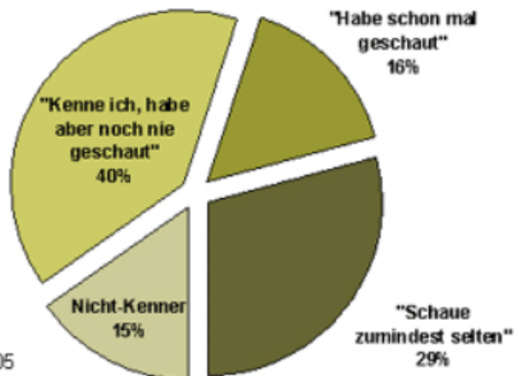
Anteil der Kenner und Zuschauer von Teleshopping an den TV-Nutzern in Deutschland

Basis: TV-Nutzer, n=960